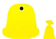
METALE I TWORZYWA SZTUCZNE